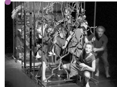
MAUGLÍ (Bratislavské bábkové divadlo)