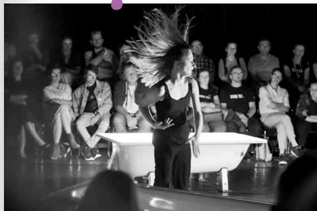
VNORENÁ (Odivo)