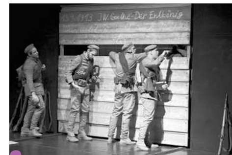
NA ZÁPADO NIČ NOVÉ (Divadlo Ludus, Bratislava)

a výtvarnosť. Plechová Mína Divadla Piki bola nielen výborným bábkovým predstavením a zábavným zážitkom pre deti. Vzhľadom na prebiehajúcu vojnu na Ukrajine navyše rozprávka získala nové významy. Aj Divadlo Ludus v rámci festivalu prezentovalo inscenáciu na tému vojny, no pre staršie publikum. Ich Na západo nič nové je silná inscenácia o stratenej generácii, vo výbornom podaní mladých hercov, ktorí dokázali jednoduchými scénickými prostriedkami vtažiť do príbehu aj mladé publikum.