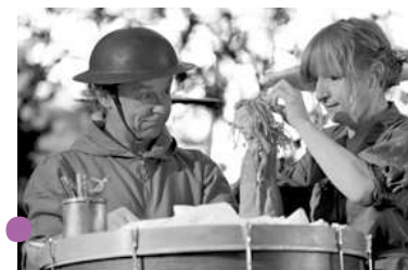
PLECHOVÁ MÍNA (Divadlo Piki)

inštitúcií dotovaných štátom a samosprávou, od ktorých je stále závislá väčšina tvorby.